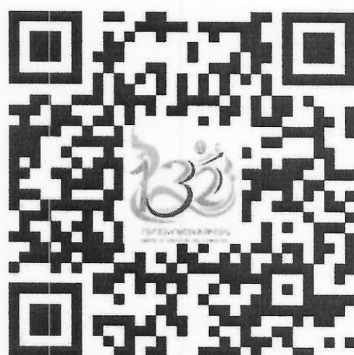
แบบบันทึกข้อมูลบุคคล ฯ