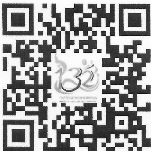
คู่มือการสรรหาปราญ์เกษตรของแผ่นดิน ปี ๒๕๖๕