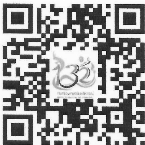
แผ่นพับประชาสัมพันธ์ปราญ์เกษตรของแผ่นดิน ปี ๒๕๖๕