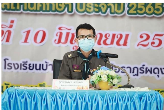
ภาพกิจกรรม/จดหมายข่าว

๓. ผู้เข้าร่วมกิจกรรมมีความตระหนักถึงความสำคัญในการจัดกิจกรรมลูกเสือในสถานศึกษา และปฏิบัติได้อย่างถูกต้อง