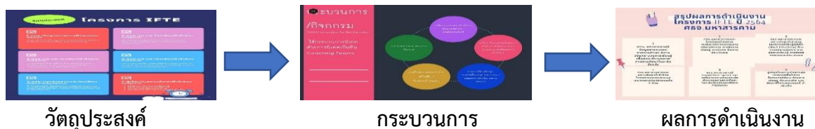
แผนภาพการดำเนินงานตามโครงการ IFTE ปี ๒๕๖๔ ศรจ. มหาสารคาม

๑๒.การถอดบทเรียนจากการดำเนินโครงการ : ทางสถานศึกษาที่เข้าร่วมโครงการมีความพึงพอใจในระดับมาก เห็นตรงกันว่าเป็นโครงการที่มากที่สุดในการพัฒนานวัตกรรมและคุณภาพการศึกษาด้วยการนิเทศ ติดตาม ประเมินผล แบบทีมโค้ช (Coaching Team) ด้วย Supervisor Teams ควรมีโครงการนี้ต่อเนื่องต่อไป มีการขยายผลให้ถึง โรงเรียนทั่วทุกสังกัดทั้งจังหวัด และให้มีการนิเทศตั้งแต่เนิ่น ๆ ต้นปีการศึกษาเริ่มจากตั้งแต่เปิดภาคเรียนเลยเพื่อ ทางโรงเรียนจะได้นำข้อชี้แนะจากทาง Supervisor Teams ไปปรับปรุงพัฒนาการจัดการศึกษา จัดให้มีการแลกเปลี่ยนเรียนรู้ในกลุ่มย่อยที่แบ่งเป็นโซนโรงเรียน และนำมาแลกเปลี่ยนการเรียนรู้ในกลุ่มใหญ่ในระดับจังหวัด หากไม่มีการแพร่ระบาดของโควิด ๑๙ ขอให้ทาง Supervisor Teams ลงนิเทศพื้นที่จริง ให้ครบทุกโรงเรียน เพราะส่งผลต่อการพัฒนาคุณภาพการศึกษาของโรงเรียนได้อย่างแท้จริงและดียิ่ง