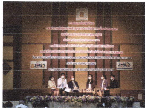
ภาพประกอบการจัดกิจกรรมที่ ๒ (จุดที่ ๓ สำนักงานศึกษาธิการภาค ๑๐)