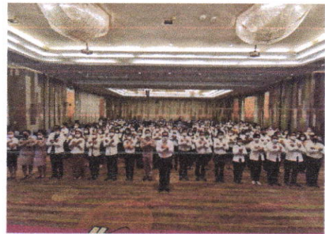
ภาพประกอบการจัดกิจกรรมที่ ๒ (จุดที่ ๒ สำนักงานศึกษาธิการภาค ๑๔)